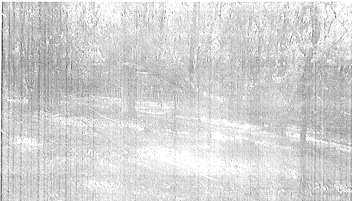
UP IV Iclod, ua 111C, pădure proprietate de stat, S=11,54 ha, 21.10.2017